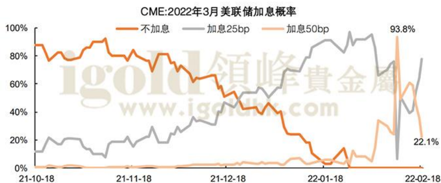
3月份加息50基点的概率大降

(注：交易数据仅作为交易密集度的一个反映，不作为真实交易数据解读，数据来源网络相关统计。)