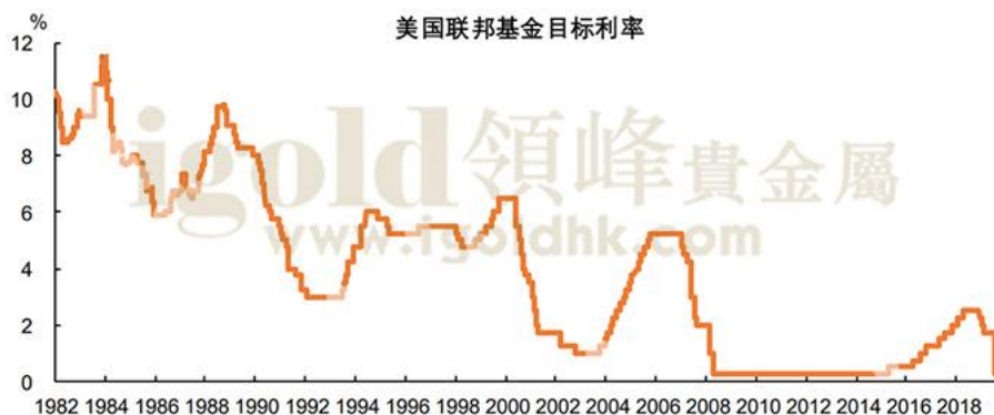
美联储13次降息后，12次加息幅度不超过25基点

(注：交易数据仅作为交易密集度的一个反映，不作为真实交易数据解读，数据来源网络相关统计。)