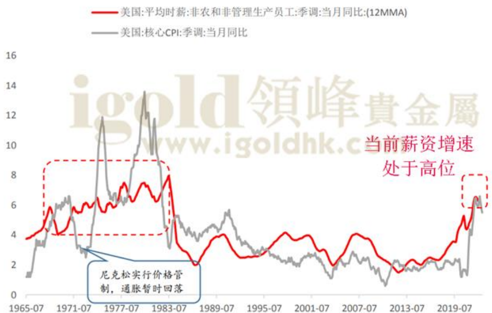
图5--美国薪资和通胀的关系

(注: 交易数据仅作为交易密集度的一个反映, 不作为真实交易数据解读, 数据来源网络相关统计。)