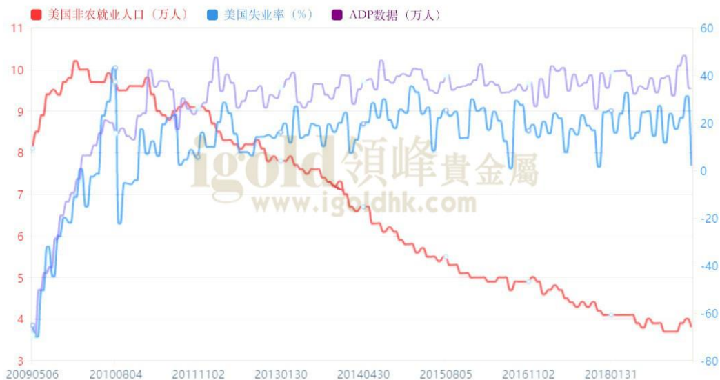
美国非农就业人数、失业率及ADP复合图

美国3月季调后非农就业人口(万人)及失业率将于本周五(4月5日)晚20:30公布, 关于美国非农就业人数及失业率走势详见下方复合图。图表中可看出自2012年中旬开始, 美国就业人数就基本处于非常平稳的状态, 且平均值维系于17-20万人区间内。失业率近九年一直保持稳步式回落, 从去年开始就长期低于5.0%, 上月失业率公布值为3.8%, 本次预期值保持一致, 较再之前的增长已出现回落态势。美国2月非农就业人口公布值意外冷门报出2万人, 受此影响, 金价出现近40美金拉升行情。目前市场普遍预期值为17.5万人, 预期符合市场长期的平均水平, 故数据前黄金市场承受利空压力, 但受此影响黄金形态并未出现连续破位式行情, 反而于1280关口上方短暂盘整企稳。综合判断, 本次非农出现利空结果的概率极大, 但金价能否受到正向打压, 是本次非农操作需面对的最重要考题。个人判断, 本月非农数据或将成为黄金现阶段结构形态发生改变的重要导火索之一, 且是黄金多头被一触即发的概率极大, 具体操作将在直播间进行实时跟进。